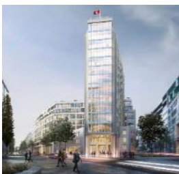
Springer Quartier Hamburg